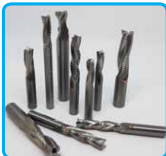
Spiralne rezkarje, grobe, fine, profilne, krogelne,...