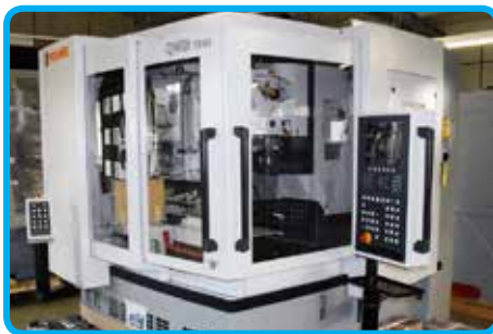
4 osni CNC brusilni stroj

Vsako orodje pri nas naredimo po naročilu, od načrtovanja, izdelave, do končne kontrole. Pri izdelavi in obnovi uporabljamo materiale priznanih evropskih proizvajalcev, najmodernejšo CNC tehnologijo obdelave, CNC balansiranja orodja, ter optično kontrolo vsakega našega izdelka.