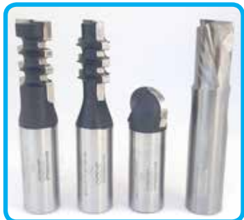
Stebelne rezkarje za CNC stroje