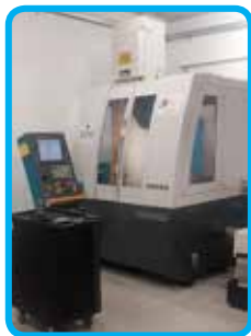
5 osni CNC brusilni stroj