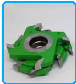
Garniture rezkarjev iz HSS materiala