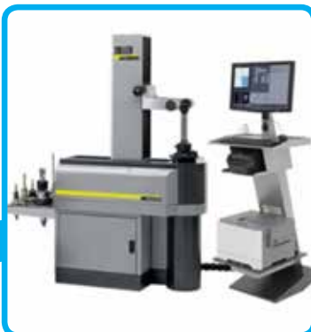
Merilni stroj ZOLLER