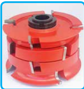
Sestavljene garniture rezkarjev