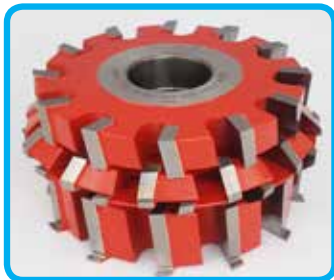
Garniture rezkarjev za obdelavo PVC in ALU materialov