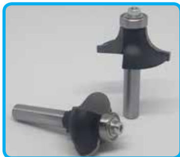
Stebelne rezkarje z ležaji