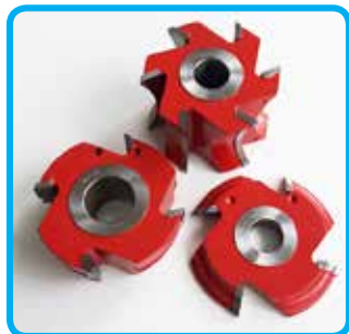
Garniture rezkarjev v HW kvaliteti

Pri zahtevnih obdelavah se poslužujemo tudi PVD prevlek za zaščito rezilnega robu, zaradi katerih je veliko večja odpornost proti obrabi. Najpogostejše prevleke so: TiN, TiAlN, AlCrN, TiAlSiN in druge.